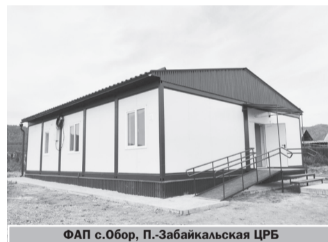
ФАП с.Обор, П.-Забайкальская ЦРБ

Монтаж модульной конструкции ФАПа в селе Обор, приобретенной по программе «Модернизация первичного звена здравоохранения», завершен. Продолжается работа по