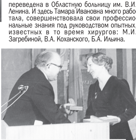
Вручение знака «Народный врач СССР», 1983 г.