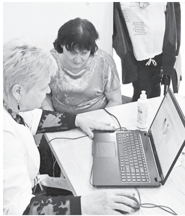
(Окончание. Начало на стр. 1)

Если основная масса миокарда здорова – то изображение на экране голубого и зеленого цвета, если есть проблемы – оттенок может меняться от желтого-оранжевого-красного до коричневого. А когда в дополнение к изображению на экране у обследуемого еще и высокое давление, и уровень общего холестерина зашкаливает – все это весьма серьезные аргументы и мотивация к тому, чтобы в ближайшее время посетить врача и пройти серьезное обследование.