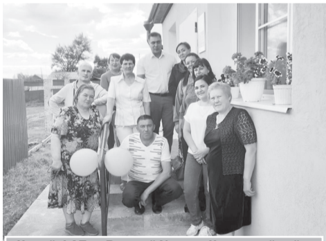
Новый ФАП с. Верхний Ульхун, Кыринский район

Забайкалье в 2023 году участвует в 11 национальных проектах, на их реализацию в бюджете региона предусмотрено почти 25 миллиардов рублей. Федеральная программа «Модернизация первичного звена здравоохранения» реализуется в рамках национального проекта «Здравоохранение» и рассчитана до 2025 года. Её задача – приблизить медицинскую помощь населению районов за счет устранения кадрового дисбаланса медработников, замены санитарного автотранспорта, приобретения медицинского оборудования, строительства и установки новых объектов, а также ремонта действующих медицинских организаций. «Безусловный приоритет – это обновление первичного звена здравоохранения», – сказал в одном из своих выступлений Президент России Владимир Путин и подчеркнул, что наша общая задача – повысить доступность и качество медицинской помощи, и особенно это касается жителей малых городов и поселков, людей старшего поколения, семей с детьми».