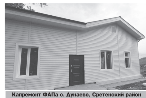
Капремонт ФАПа с. Дунаево, Сретенский район

(По материалам сайта Министерства здравоохранения Забайкальского края)