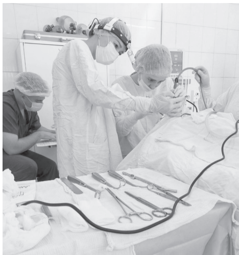
(Окончание. Начало на стр. 1)

иммунологии имени Дмитрия Рогачева в Москве. Один маленький пациент недавно вернулся из НИИЦ на контрольный осмотр в отделение.