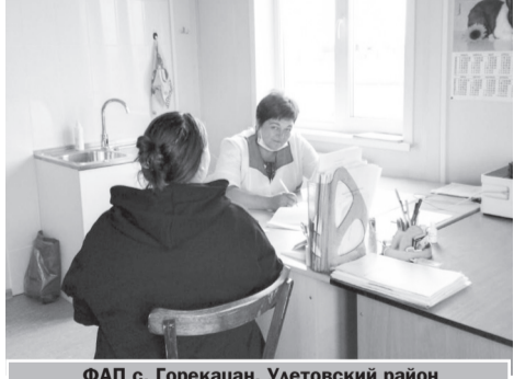
ФАП с. Горкацан, Улетовский район

В прошлом году в селе Тарбалджей Кыринского района по программе «Модернизация первичного звена здравоохранения»