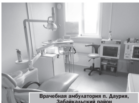
Врачебная амбулатория п. Даурия, Забайкальский район