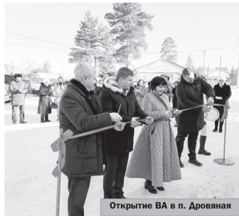
Открытие ВА в п. Дровяная

В последний месяц уходящего года в районах Забайкальского края начали действовать несколько новых объектов здравоохранения.