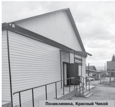
Поликлиника, Красный Чикой

От лица всех жителей района хочу поблагодарить за то, что мы попали в федеральную прог-